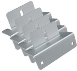
알루미늄 Z 브라켓