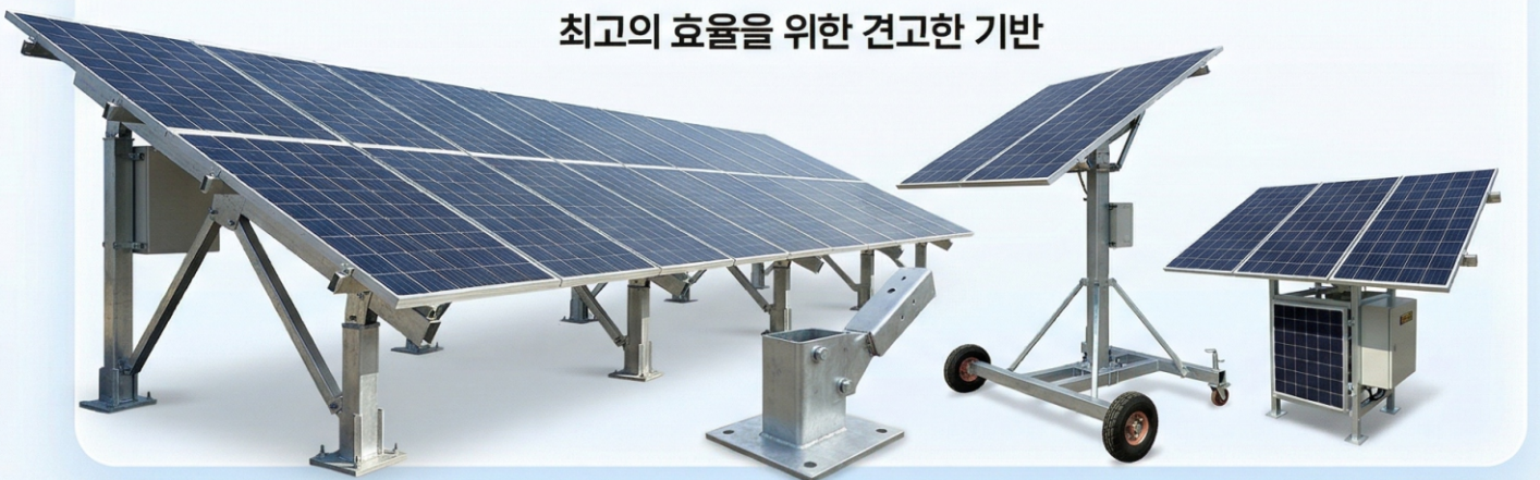
① 모듈 거치대